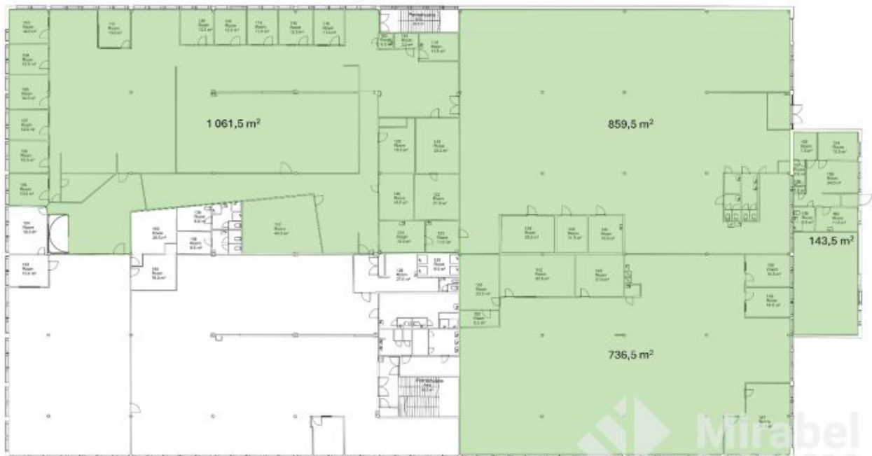
HANKASUONTIE 3, HELSINKI 2. KERROS