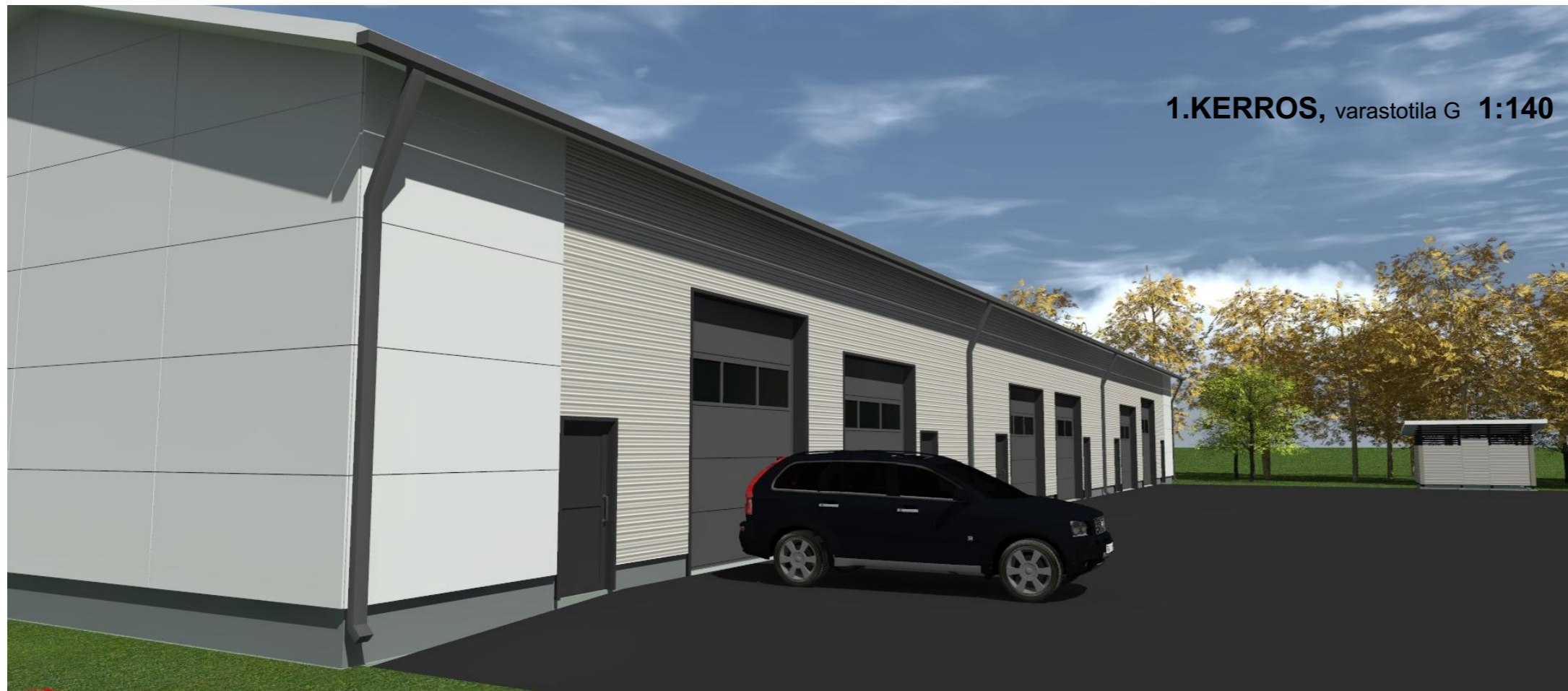
1.KERROS, varastotila G 1:140