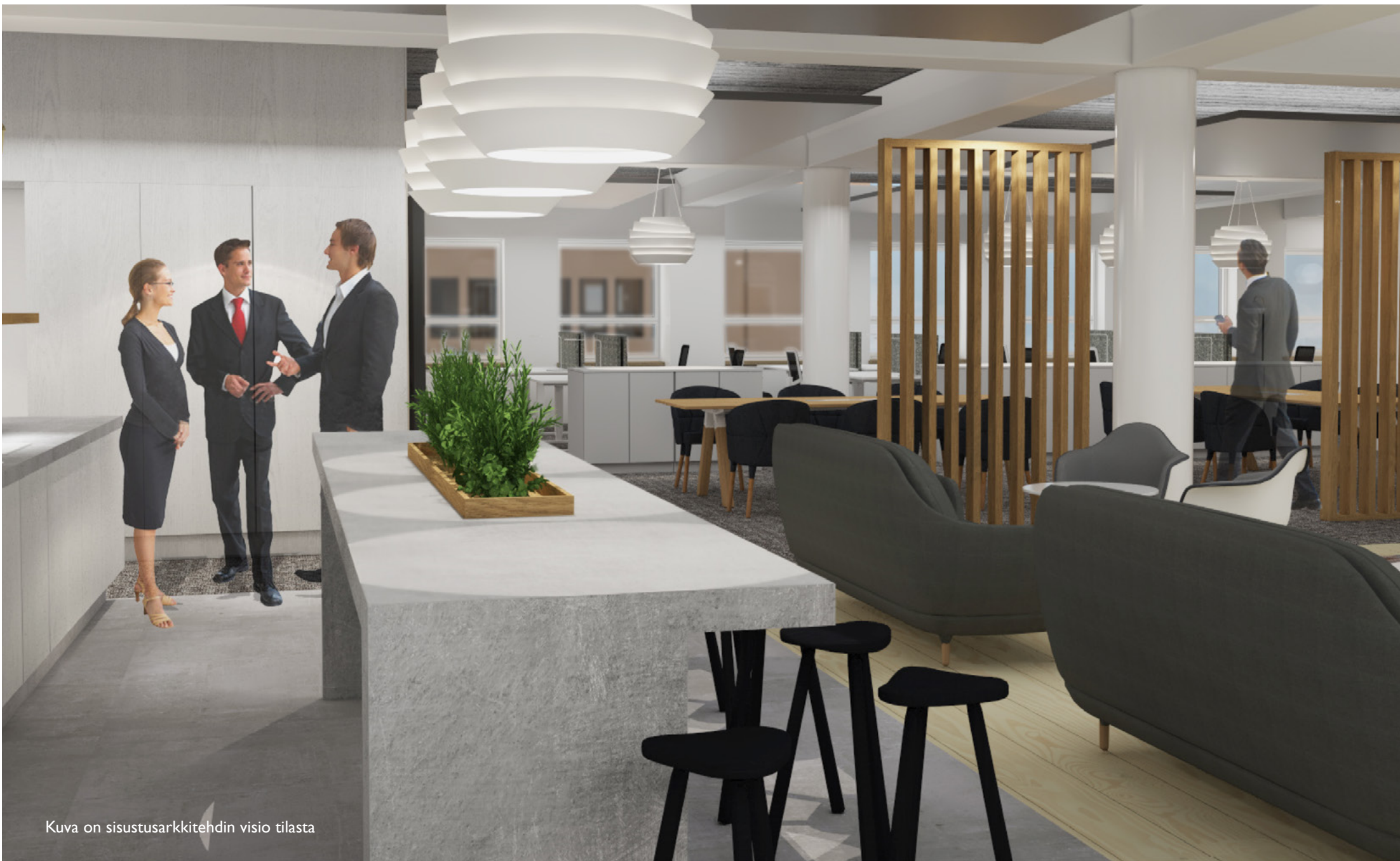
Kuva on sisustusarkkitehdin visio tilasta